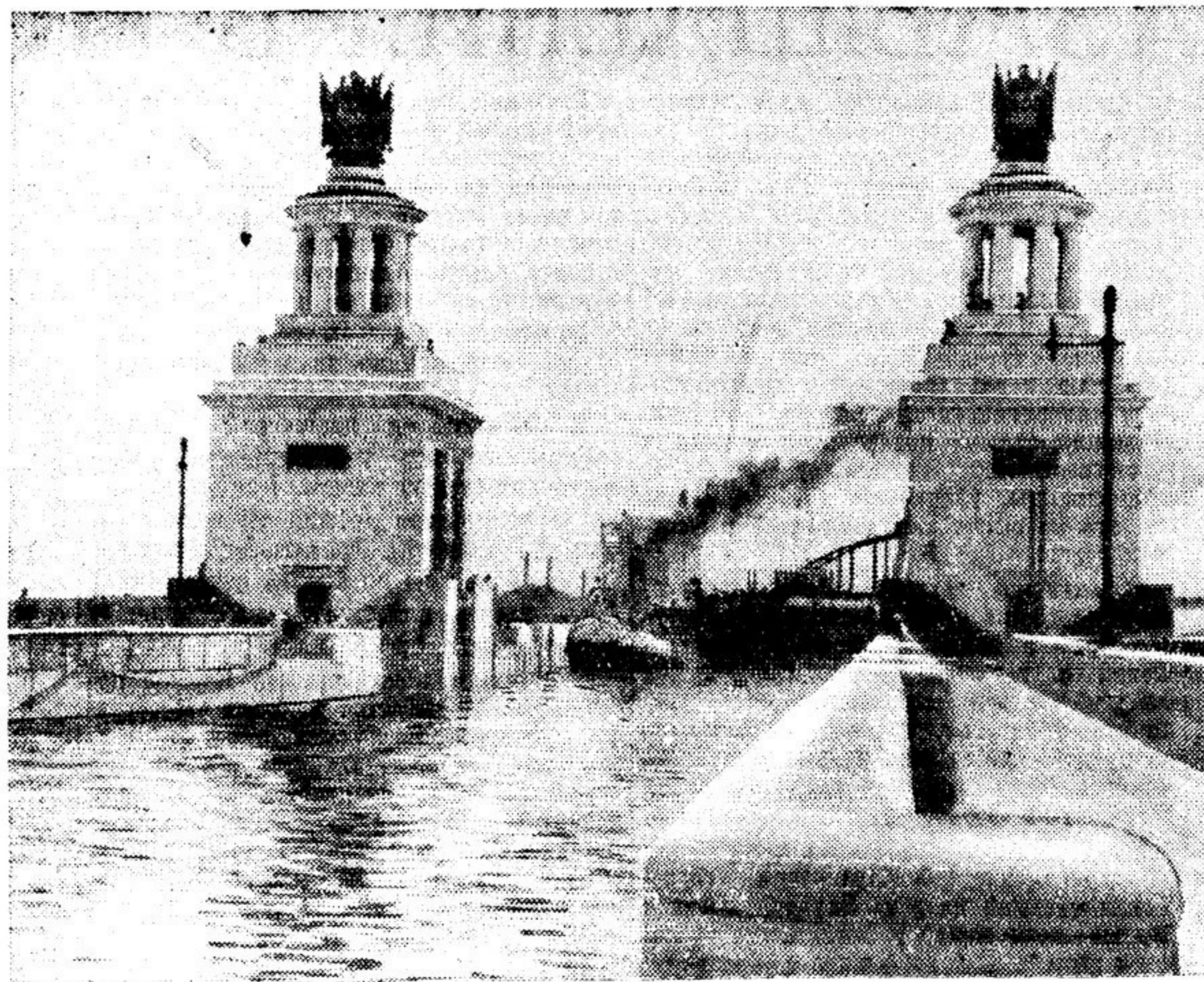
ВОЛГО-ДОНСКОЙ СУХОХОДНЫЙ КАНАЛ ИМЕНИ В. И. ЛЕНИНА. На снимках: слева — шлоз № 9, справа — арка 13-го шлоза, открывающая вход в канал со стороны Дона.