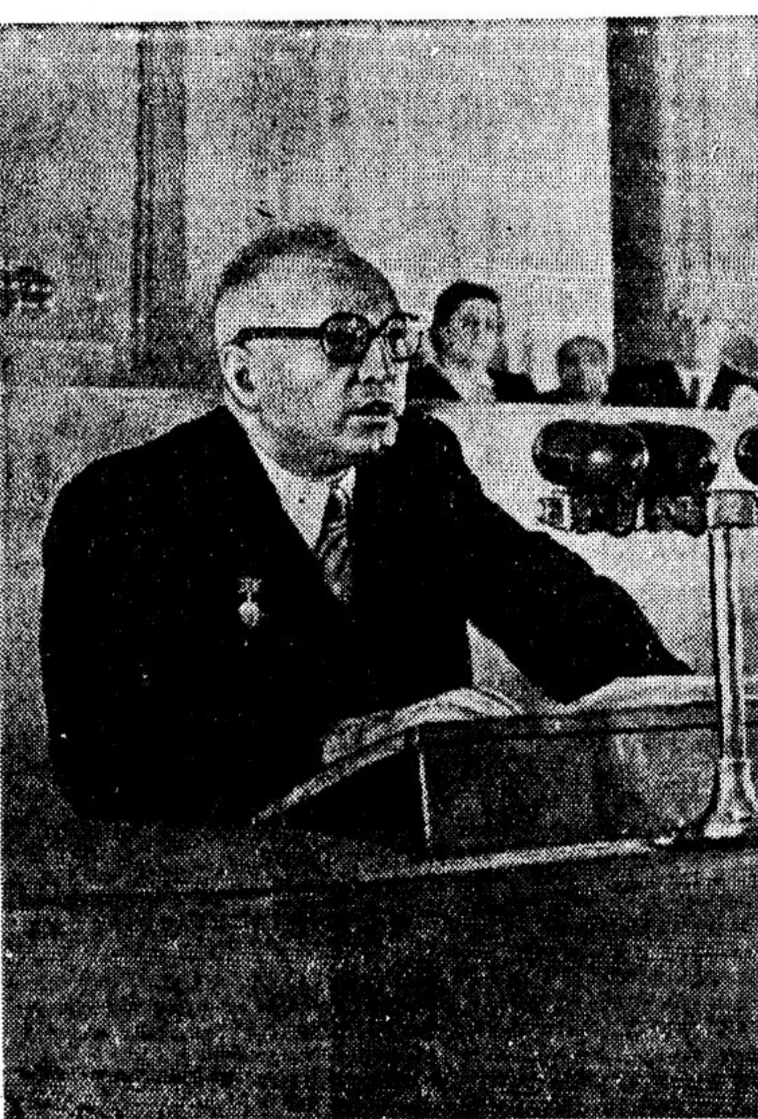
Лауреат международной Сталинской премии Пьетро Ненни выступает с речью в Свердловском зале.

К этим обязательствам я и мои друзья присоединяемся с тем большей готовностью, что мы принимаем их на себя в Москве, в столице страны, которая борется за мир и ждет много от мира! эти обязательства мы принимаем от имени Италии, для которой немалым надежда на возрождение без мира».