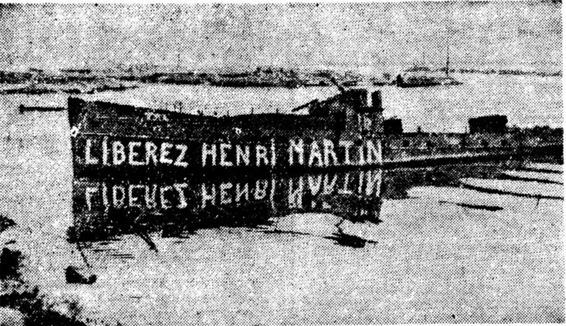
Все громче и решительнее протестует французский народ против репрессий, обрушившихся на патриотов и борцов за мир. «Свобода Андре Стиля, Анри Мартину и другим жертвам полицейского произвола» — требуют все честные французы, которым дорог мир во всем мире. НА ФОТО: одна из бесчисленных надписей в защиту Мартина в порту Марселя.